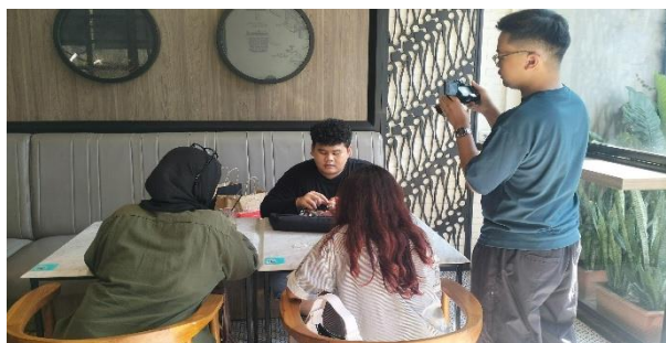
Gambar 10. Produksi Hari Ke-2

Di sini penulis dan tim mem- booking VIP room agar proses wawancara kondusif dan tidak mengganggu pelanggan lain. Sebelum memulai adegan, kami mempersiapkan segala hal yang dibutuhkan mulai dari peralatan teknis seperti perakitan kamera pada tripod, penyesuaian lighting , dan pemasangan clip-on .