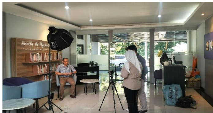
Gambar 7. Produksi Hari Ke-1

Setiap keputusan yang diambil memiliki dampak langsung terhadap kualitas akhir film dokumenter. Setelah kegiatan pengambilan gambar selesai, penulis melakukan evaluasi menyeluruh terhadap materi yang telah direkam, baik dari sisi visual maupun audio, guna memastikan tidak ada kekurangan. Apabila ditemukan ketidaksesuaian atau kekurangan, maka langkah antisipatif akan segera diambil.