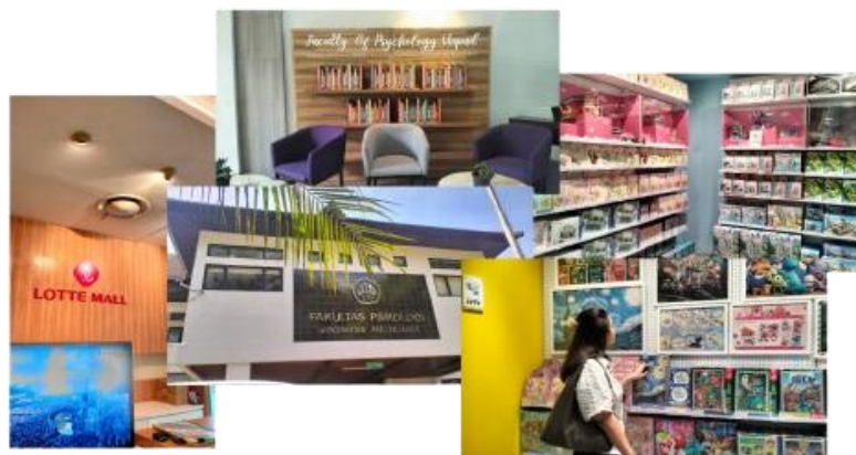
Gambar 6. Recce dan Observasi

Menyusun Rancangan Anggaran Biaya. Penyusunan anggaran dilakukan guna merinci kebutuhan produksi secara realistis. Perincian anggaran mencakup konsumsi kru, biaya transportasi, penyewaan peralatan, serta dana cadangan untuk keperluan tak terduga. Dokumen ini berfungsi sebagai pedoman selama proses produksi untuk menghindari pemborosan dana, sekaligus menjadi elemen penting dalam laporan pertanggungjawaban administratif tugas akhir.