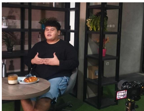
Gambar 9. Produksi Hari Ke-2

Terdapat beberapa kendala mengenai perizinan dengan pihak manajemen mall, namun untungnya penulis sudah menyiapkan alternatif lokasi lain yang lebih memungkinkan. Penulis mengarahkan narasumber untuk melakukan berbagai adegan sesuai dengan storyboard, mulai dari candid berjalan, melihat-lihat barang di toko, hingga menaiki lift . Disini penulis juga berkoordinasi dengan camera person dan scriptwriter agar adegan yang diambil tetap runtut dan sesuai dengan planning awal.