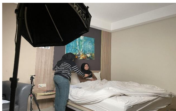
Gambar 11. Dokumentasi Hari Ke-2

Adegan ini sebagai salah satu gambaran dari pendekatan naratif yang penulis implementasikan dalam film dokumenter ini, dimana digambarkan bahwa narasumber adalah seseorang yang sangat mengikuti perkembangan trend di media sosial mulai dari selalu nongkrong di cafe, update di media sosial, hingga memiliki berbagai bag charm yang sedang viral.